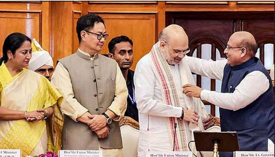
નવી દિલ્હીમાં દિલ્હી વિધાનસભા ભવન ખાતે યોજાયેલી એલ ઈન્ડિયા સ્પીકર્સ કોન્ફરન્સમાં ઉપસ્થિત કેન્દ્રિય ગૃહમંત્રી અમિત શાહનું દિલ્હીના ઉપરાજ્યપાલ વિનયકુમાર સક્સેના અભિવાદન કરી રહ્યા છે સાથે દિલ્હી વિધાનસભાના સ્પીકર વિજેન્દર ગુપ્તા અને મુખ્યમંત્રી રેખા ગુપ્તા નજરે પડે છે.

કર્ણુ, પરંતુ ચૂંટણી પંચે તેમને સોગંદનામું ન માંગ્યું તે દર્શાવે છે કે ચૂંટણી પંચ તટસ્થ નથી. સ્પેશિયલ ઈન્ટેન્સિવ રિવિઝન (SIR) વોટ ચોરીની એક પદ્ધતિ છે. બિહારમાં ૬૫ લાખ લોકોના નામ કાઢી નાખવામાં આવ્યા હતા, પરંતુ ભાજપ એક પણ ફરિયાદ કરી રહી નથી. આનું કારણ એ છે કે ચૂંટણી પંચ, ચૂંટણી કમિશનર અને ભાજપ વચ્ચે સાંકળાંક છે. જો કે, તેમણે બિહારમાં મુખ્યમંત્રીના ચહેરાના સવાલ પર મૌન જાળવી રાખ્યું