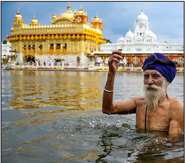
શીખોના ૨૪ ઓગષ્ટથી શરૂ થયેલા શ્રી ગુરૂ ગ્રંથ સાહિબજીના પ્રથમ પ્રકાશ ઉત્સવની અમૃતસર સ્થિત સુવર્ણ મંદિર ખાતે ઉજવણી દરમિયાન સુવર્ણમંદિર ખાતેના સરોવરમાં એક શીખ શ્રધ્ધાળુ પવિત્ર સ્થાનનો લ્હાવો લઈ રહ્યો છે.

નવી દિલ્હી તા.૨૪ દેશમાં માગો પર ફરતા જુના વાહનો કે બે પ્રદુષણ વધારે છે તથા અકસ્માત થવાની શક્યતા પણ વધી જાય છે તે વચ્ચે સ્કેપ પોલીસીમાં બજી સફળતા ન મળતા હવે કેન્દ્ર સરકારે ૨૦ વર્ષ કે તેથી જુના વાહનોના રજીસ્ટ્રેશન રીન્યુઅલ ફીમાં ડબલ વધારો કર્યો છે. કેન્દ્રના નોટીફિકેશન મુજબ ટુર્લીલર કે બે ૨૦ વર્ષથી જુના છે તેની રજીસ્ટ્રેશન ફી રૂ.૧૦૦૦૦ ને બદલે ૨૦૦૦ રહેશે. શ્રી વ્હીલર કે ક્વા ડ્રાઈસિકલની રજીસ્ટ્રેશન ફી રૂ.૩૫૦૦માંથી વધારીને રૂ.૫૦૦૦ કરવામાં આવી છે. જયારે લાઈટ મોટર વ્હીકલની રજીસ્ટ્રેશન ફી રૂ.૫૦૦૦માંથી ૧૦૦૦૦ કરવામાં આવી છે અને જો તે આયાતી હશે તો તેની ફી ૮૦ અને ફોર વ્હીલરમાં રૂ.૧૨૦૦૦ અને ફોર વ્હીલરમાં રૂ.૮૦૦૦૦ હશે. આ નવો વધારો ૨૧ ઓગસ્ટથી લાગુ થઈ ગયો છે. સુપ્રીમકોર્ટે હાલમાં જ ૧૦ વર્ષથી જુના વાહનો માટે રજીસ્ટ્રેશન ફી વધારવા લીલીઝંડી અપી હતી.